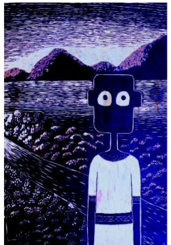
Woodcut by Lulit Melaku, Addis Ababa, Ethiopia