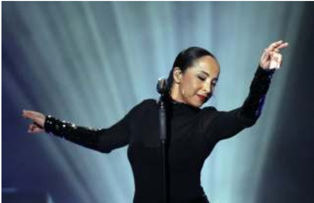
SADE Adu hatte Erfolgshits wie „Smooth Operator“ and „Soldier of Love“

Die Idee zu dem Project kam von Musik. Genauer von Musik von der Sängerin / Band SADE .