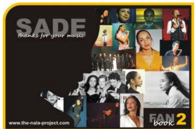
Das neue SADE Fanbuch 2.0

Ich übergab die Kopie des Fanbuches an einen Mitarbeiter von SADE, als ich während meines Deutschlandaufenthaltes London besuchte.