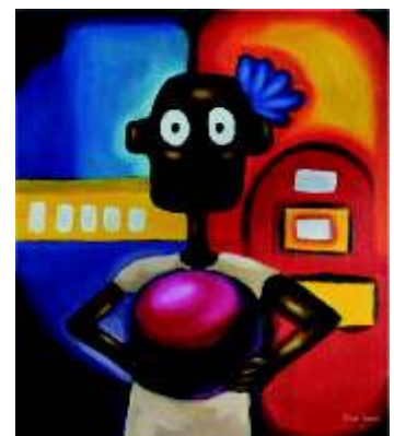
Brian Kumira, Bulawayo / Zimbabwe 2013

162 Kunstwerke von 112 Künstlern aus 11 Ländern.