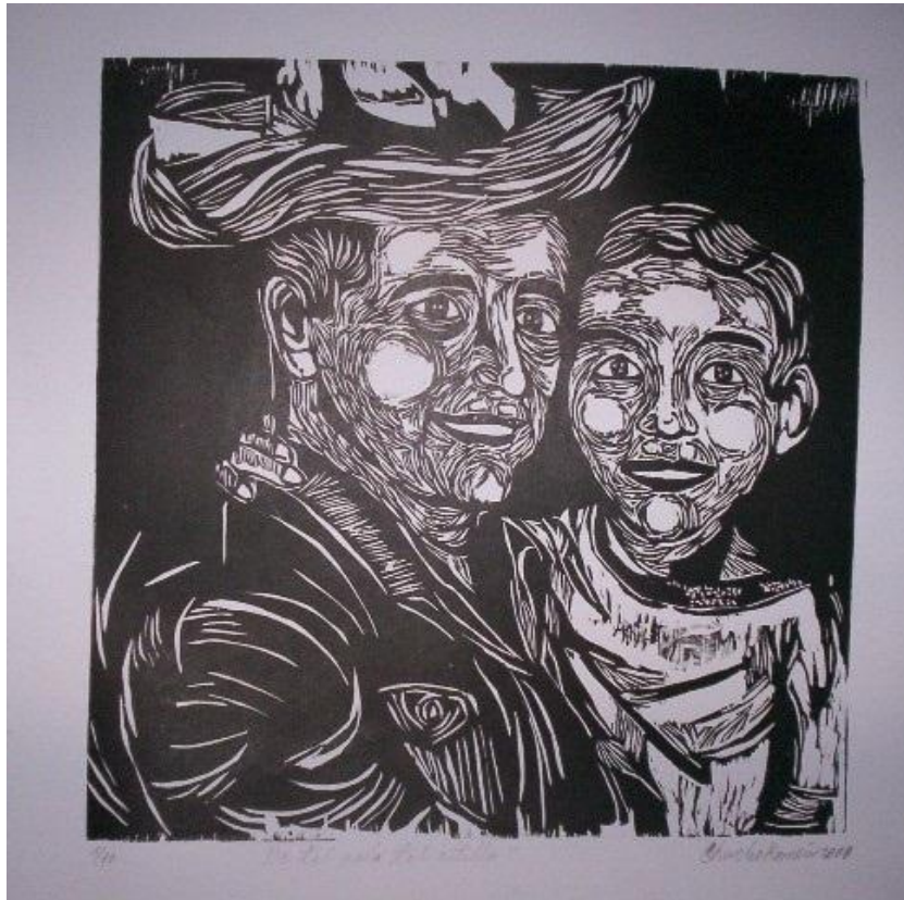
Autor: Chucho Roméu Título: De tal Palo tal artilla Técnica: Xilografía