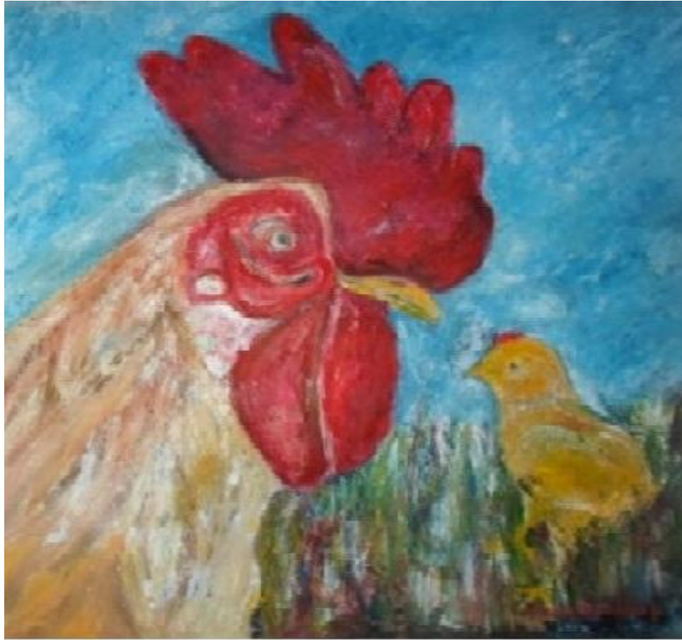
Autor: Chucho Roméu Título : Disputa Territorial Técnica: Oleo /Lienzo