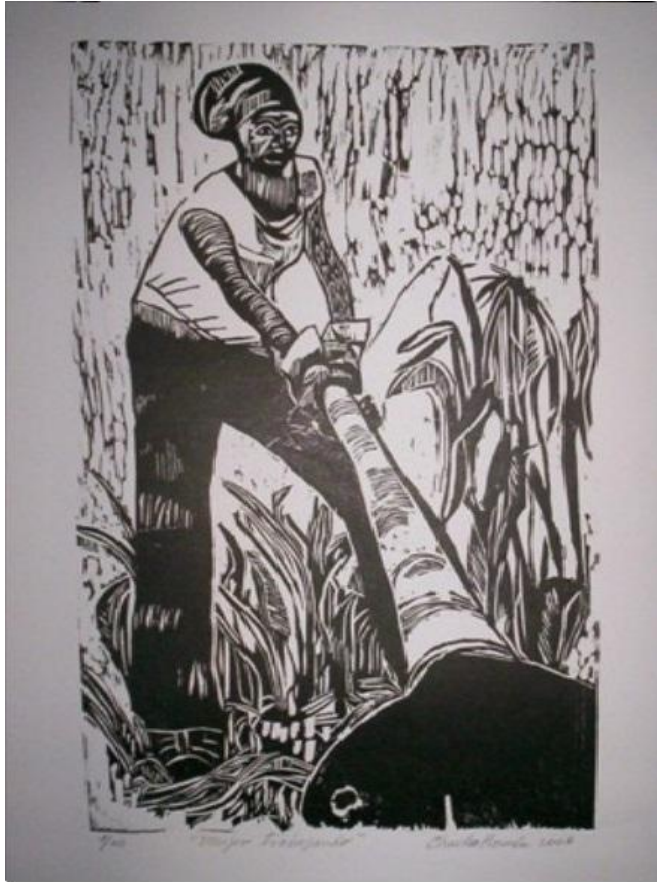
Autor: Chucho Roméu Título: Mujer trabajando Técnica: Xilografía