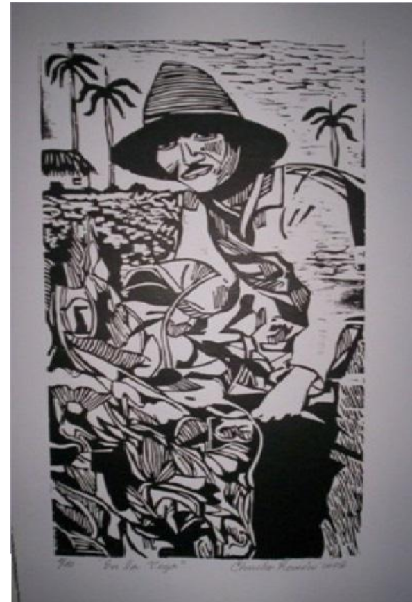
Autor: Chucho Roméu Título: En las vega Técnica: Xilografía