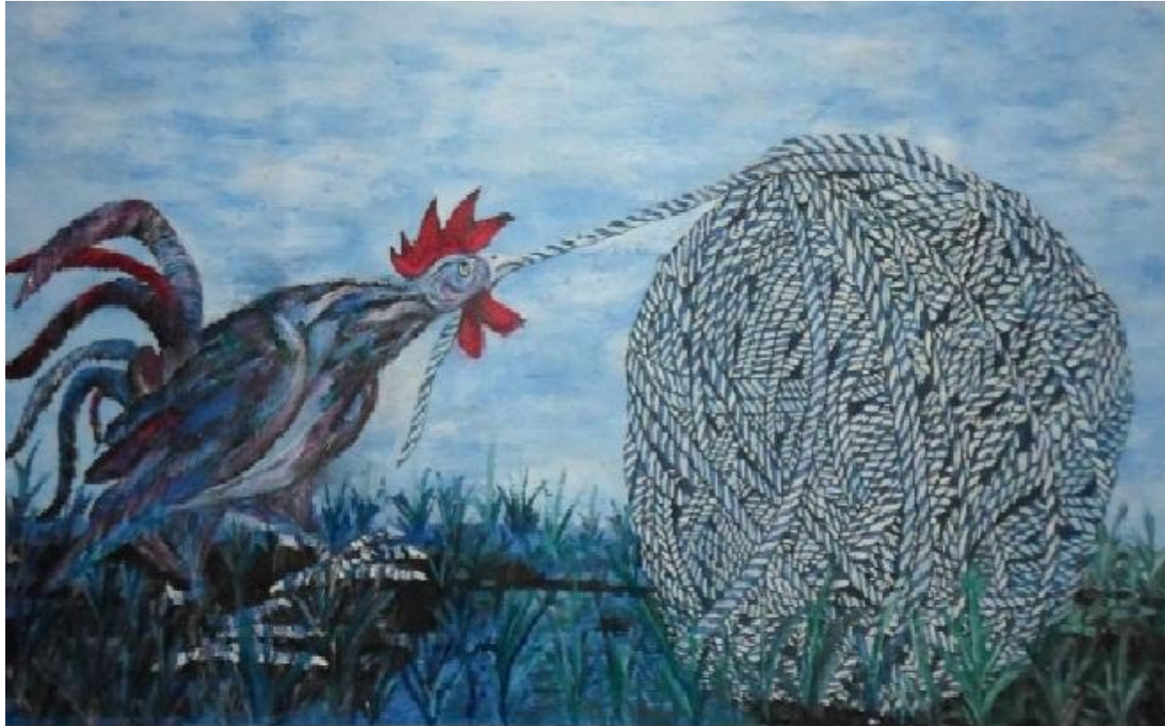
Autor: Chucho Roméu Título : Siguiendo la cordura Técnica: Oleo /Lienzo