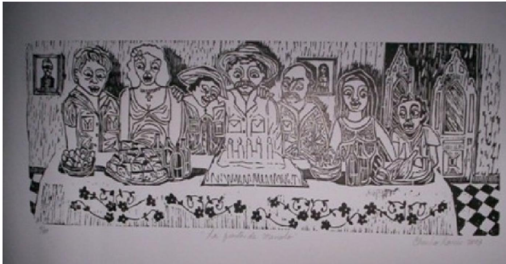
Autor: Chucho Roméu Título: La fiesta de Manolo Técnica: Xilografía