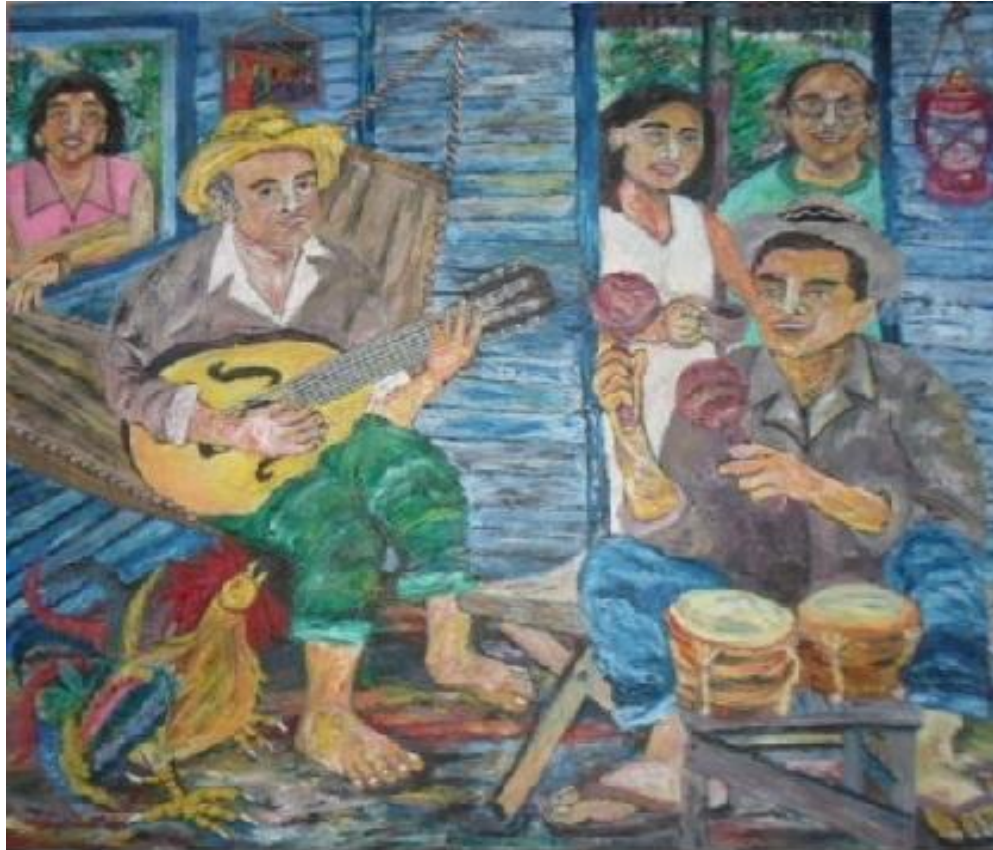
Autor: Chucho Roméu Título : De donde son los cantante Técnica: Óleo /Lienzo