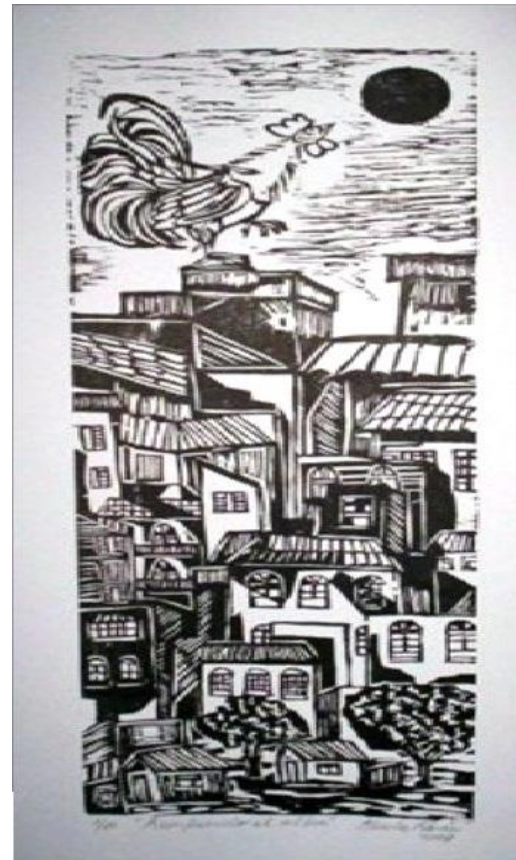
Autor: Chucho Roméu Título: Rompiendo el alba Técnica: Xilografía