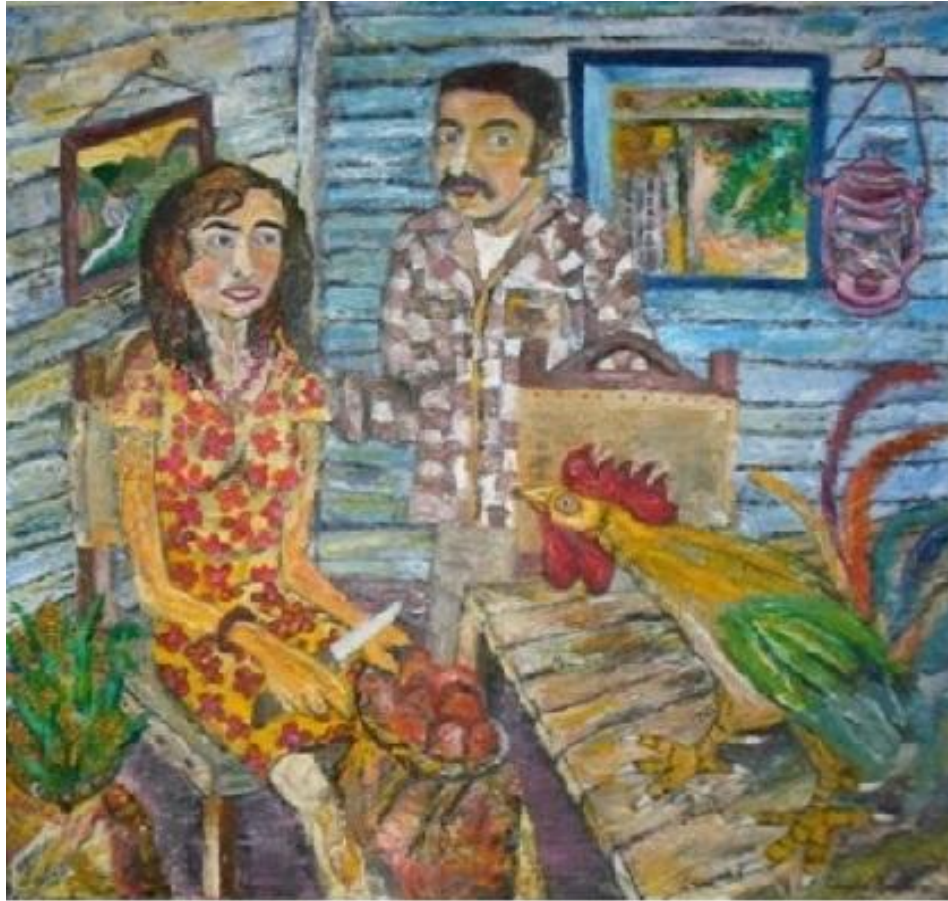
Autor: Chucho Roméu Título : La mesa está servida Técnica: Oleo /Lienzo