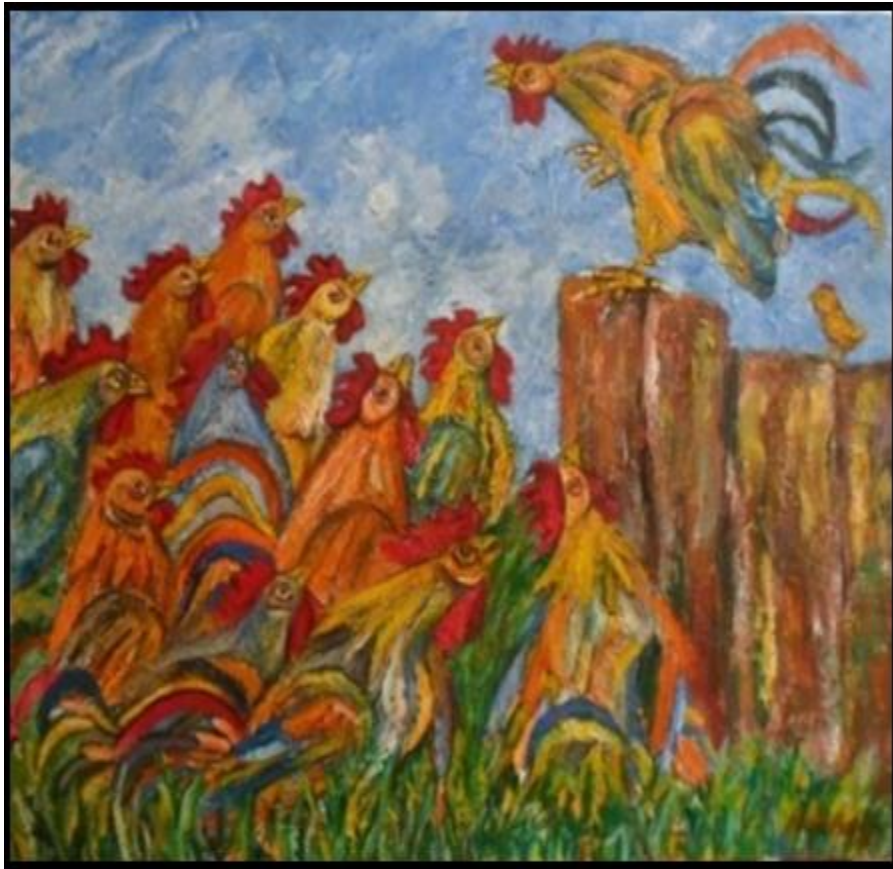
Autor: Chucho Roméu Título: "Enunciación" Técnica: Óleo / Tela