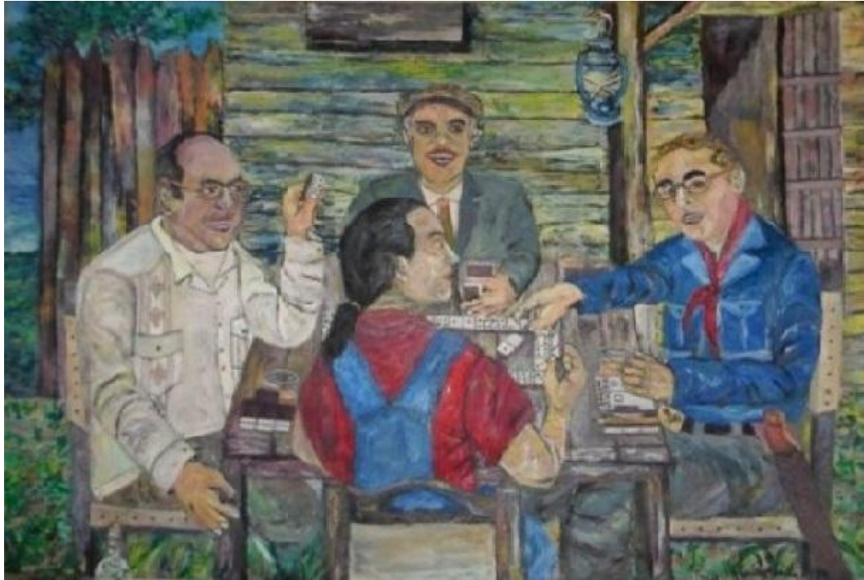
Autor: Chucho Roméu Título : La última jugada Técnica: Oleo /Lienzo