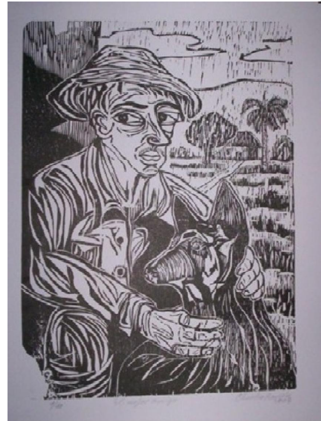
Autor: Chucho Roméu Título: El mejor amigo Técnica: Xilografía