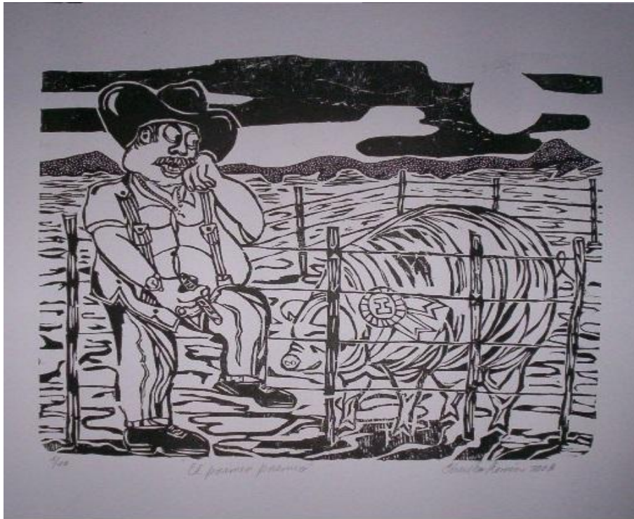
Autor: Chucho Roméu Título: El primer premio Técnica: Xilografía